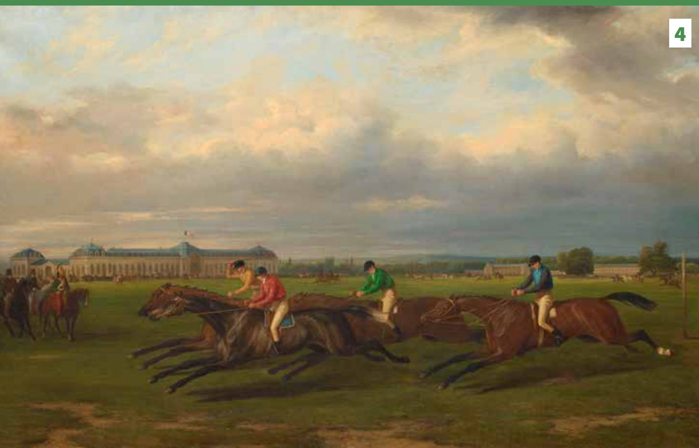
4. Courses à Chantilly en mai 1836, prix d'Orléans, Pierre Vernet