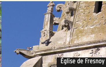
Eglise de Fresnoy