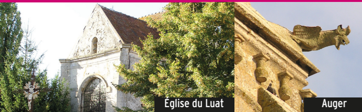
Eglise du Luat