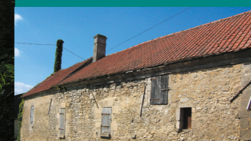
Corps de ferme

Plus bas, des prairies subsistent encore. Aux abords de la rivière, de nombreux marais existent du fait de la stagnation en surface des eaux. Ces fonds de vallée sont désormais souvent plantés de peupliers, ce qui assèche le milieu et restreint la diversité biologique.