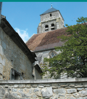
Église de Feigneux