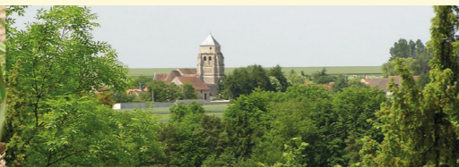
Feigneux depuis le Chatel