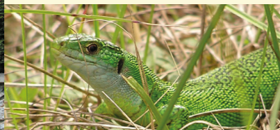
Lézard vert au Chatel