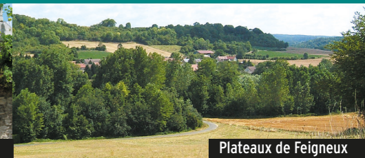
Plateaux de Feigneux

L e village de Feigneux est situé en bordure du plateau du Valois, en surplomb de la vallée de l'Automne et du vallon du ru de Feigneux. En raison vraisemblablement de cette position, l'église du XI e siècle présente la particularité d'être fortifiée au XVI e . Plusieurs éléments de petit patrimoine sont également conservés dans le village : l'ancien cimetière, la pompe à incendie et même la prison.