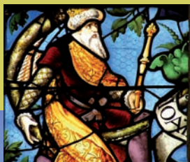
Vitrail à Fresnoy (détail)

célèbre pour ses croisées d'ogives primitives. Visites commentées et animations attendent les visiteurs dans toutes ces églises et chapelles ouvertes pour l'occasion.