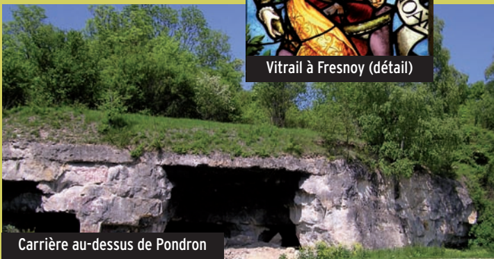
Carrière au-dessus de Pondron