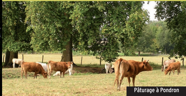
Pâturage à Pondron

De nombreux lavoirs jalonnent le circuit, ainsi qu'un bief (canal qui alimentait la chute d'eau du moulin) visible à Pondron sur la gauche après le carrefour. Les fonds de vallée sont essentiellement utilisés pour la culture du peuplier.