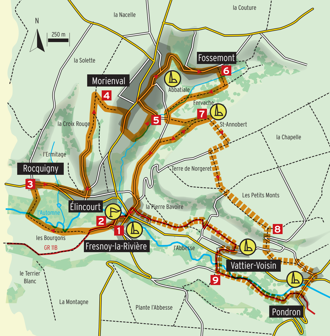
Abbatiale de Morienvall