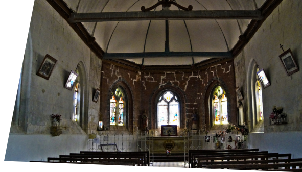
Intérieur de la chapelle Sainte Restitude de Dargies