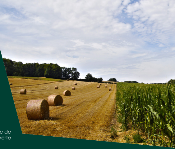
Paysage de Picardie verte