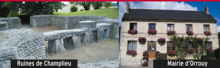
Ruines de Champlieu