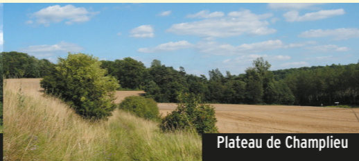
Plateau de Champlieu