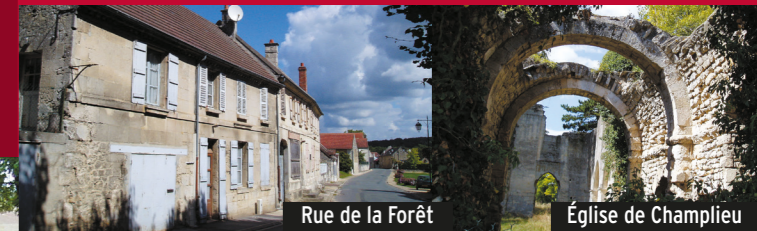
Rue de la Forêt