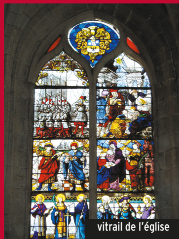
vitrail de l'église

Autre particularité, les cavées sont d'anciennes vallées étroites et encaissées, parfois transformées en chemins reliant la vallée au plateau. En raison de l'humidité, une végétation riche s'y développe.