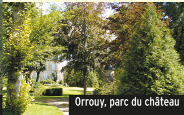
Orrouy, parc du château