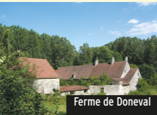
Ferme de Doneval