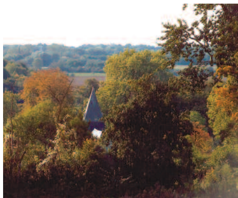
Vue du clocher de Ricquebourg.

fourche (10), emprunter la voie de gauche et continuer tout droit. Le long du chemin forestier, longer une cabane de chasse sur la droite avant d'atteindre un petit plateau, (11). Après 500 m sur le plateau bifurquer à droite (12) afin de suivre le sentier qui longe le « Bois de la Motte ». Après avoir abouti au chemin qui conduit au hameau de « la Motte », partir sur la gauche (13) et continuer tout droit (14) afin de rejoindre le « cimetière de Gury » achevant ainsi la promenade.