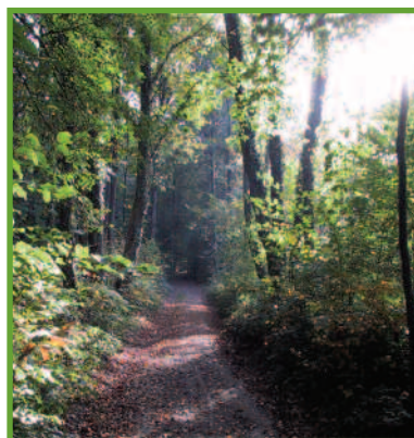
Le bois de Ricquebourg.

Au printemps, de remarquables parterres de jonquilles ( narcissus pseudonarcissus ), de jacinthes bleues ( hyacinthoides non scriptus ) et de muguet ( convallaria maialis ) tapissent les sous-bois.