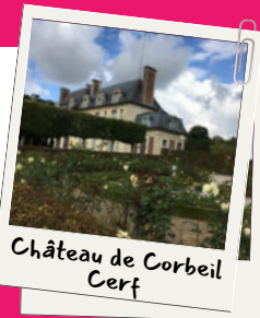
Château de Corbeil Cerf

Le Château de Corbeil-Cerf se trouve à quelques pas du départ de cette randonnée ! Le parc du Château se visite à la belle saison. Contactez l'Office de tourisme pour plus de renseignements.