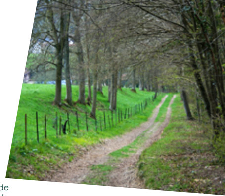
Paysage de Picardie Verte