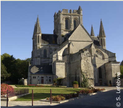
L'église Saint-Yved à Braine