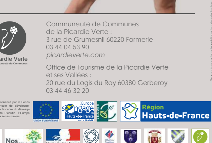
Non pas pour un de vos produits. Imprimé numérique. 10 000 exemplaires.

Ce lavoir, construit sur le bord du Thérain, fut détruit dans les années 1980 puis rebâti sur la propriété d'un particulier habitant à proximité. En 1990, il fut rendu à la commune qui l'installa à 50 mètres de son emplacement d'origine. Le moulin, quant à lui, connaît plusieurs utilisations. Après avoir cessé l'activité de moulin à blé, il fut utilisé par l'industrie optique de 1857 à 1870. Le nom de la « rue des Lunettes » témoigne de cette activité. La « Fromagerie du Thérain » y installa ses ateliers en 1907, puis de 1911 à 1939, les « Fromageries Charles Gervais » en firent un lieu de dépôt de lait.