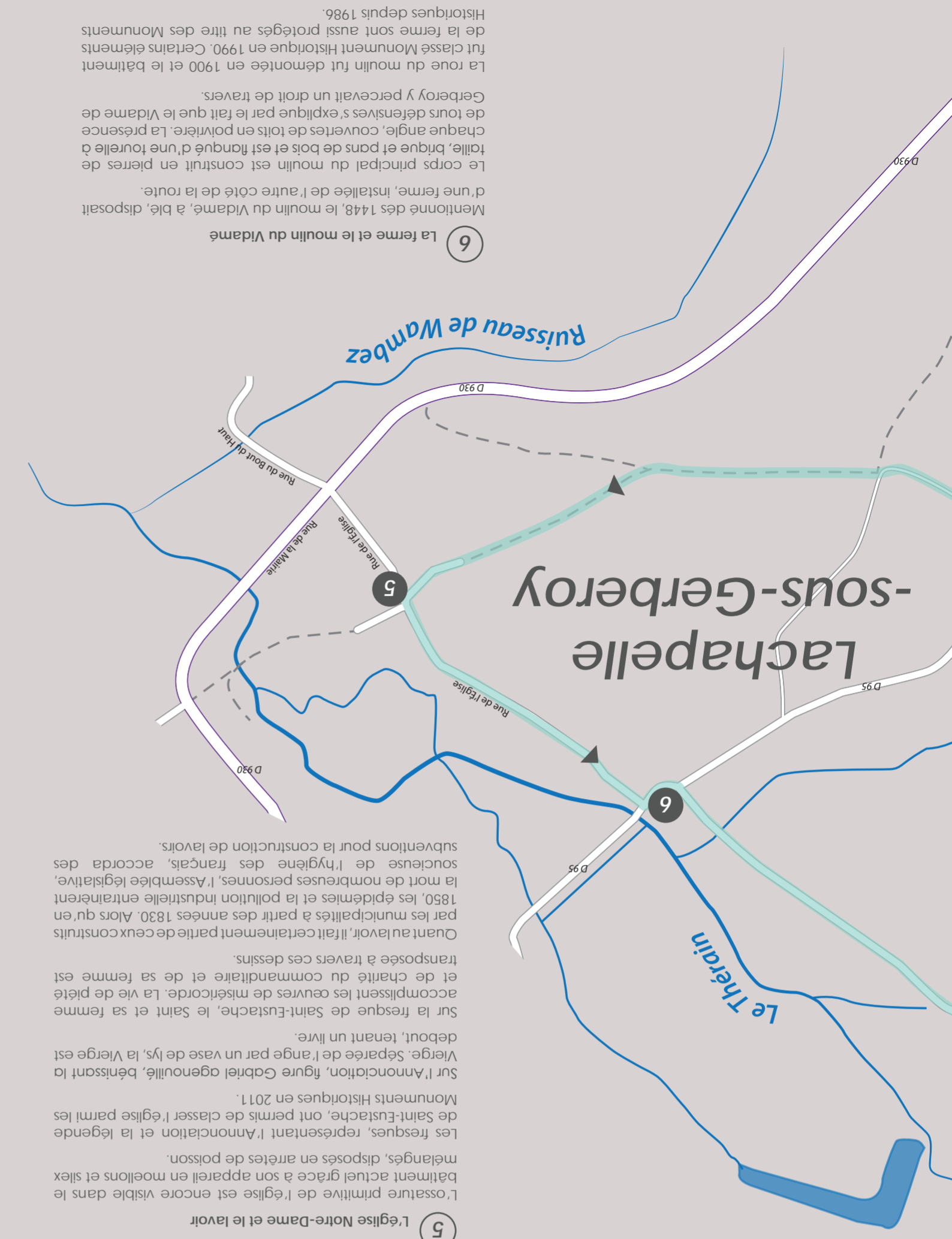
5 L'église Notre-Dame et le lavoir

L'ossature primitive de l'église est encore visible dans le bâtiment actuel grâce à son appareil en moellons et silex mélangés, disposés en arêtes de poisson. Les fresques, représentant l'Annonciation et la légende de Saint-Eustache, ont permis de classer l'église parmi les Monuments Historiques en 2011. Sur l'Annonciation, figure Gabriel agenouillé, bénissant la Vierge. Séparée de l'ange par un vase de lys, la Vierge est debout, tenant un livre. Sur la fresque de Saint-Eustache, le saint et sa femme accompagnent les œuvres de miséricorde. La vie de piété et de charité du commanditaire et de sa femme est transposée à travers ces dessins. Quant au lavoir, il fait certainement partie de ceux construits par les municipalités à partir des années 1830. Alors qu'en 1850, les épidémies et la pollution industrielle entraînaient la mort de nombreuses personnes, l'Assemblée législative, soucieuse de l'hygiène des français, accorda des subventions pour la construction de lavoirs.