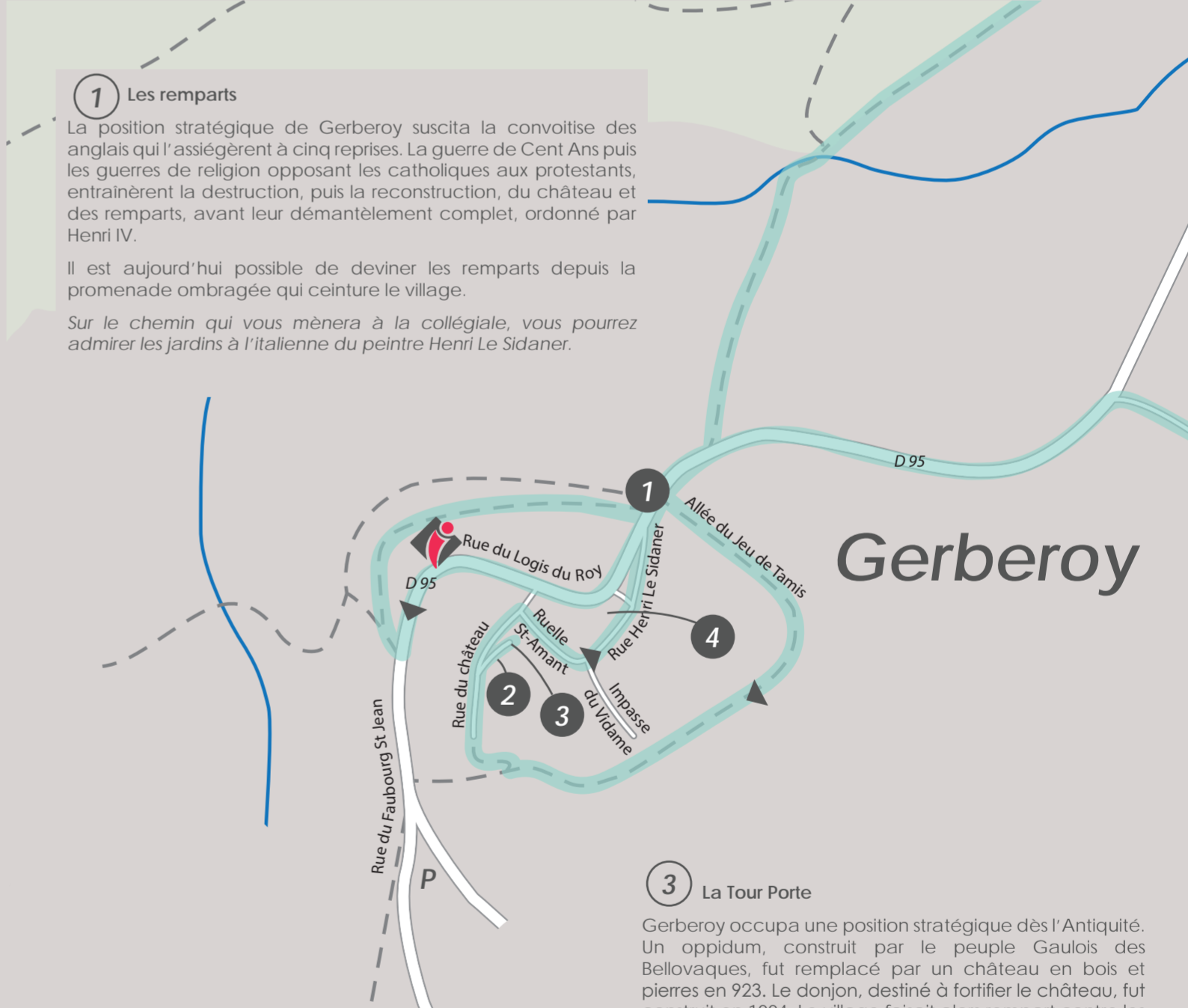
2 La collégiale Saint-Pierre

Mentionné dès 1448, le moulin du Vidamé, à blé, disposait d'une ferme, installée de l'autre côté de la route. Le corps principal du moulin est construit en pierres de taille, brique et pons de bois et est flanqué d'une touraille d'angle, couvertes de toits en pavillon. La présence de tours défensives s'explique par le fait que le Vidame de Gerberoy y percevait un droit de travers. La roue du moulin fut démontée en 1900 et le bâtiment fut classé Monument Historique en 1990. Certains éléments de la ferme sont aussi protégés au titre des Monuments Historiques depuis 1986.