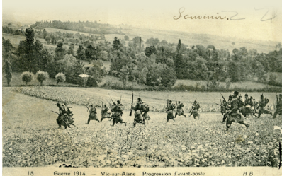
Progression des soldats à Vic en 1914

À 800 m, prendre le chemin à droite avant le pont.