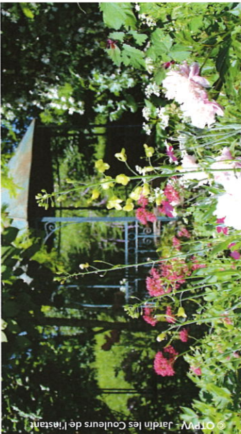
Jardin les Couleurs de l'Instant