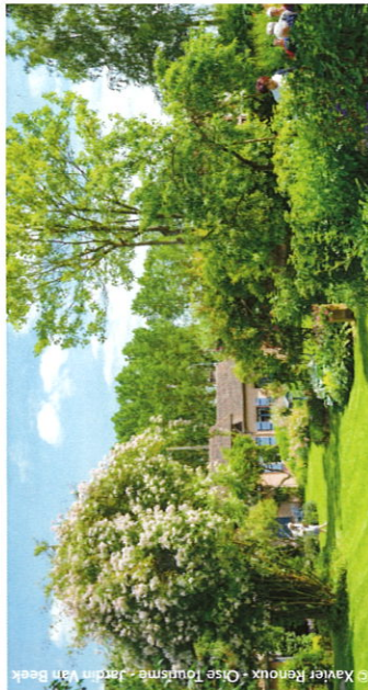
Jardin Van Beek