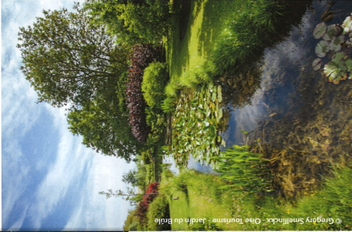
Jardin du Brûlé