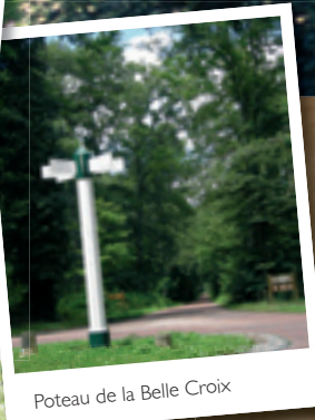
Poteau de la Belle Croix