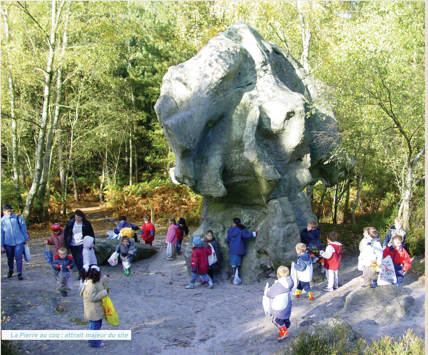
La Pierre au coq : attrait majeur du site