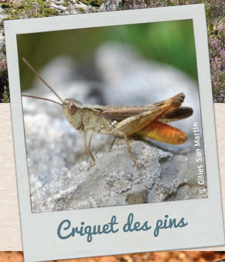
Criquet des pins