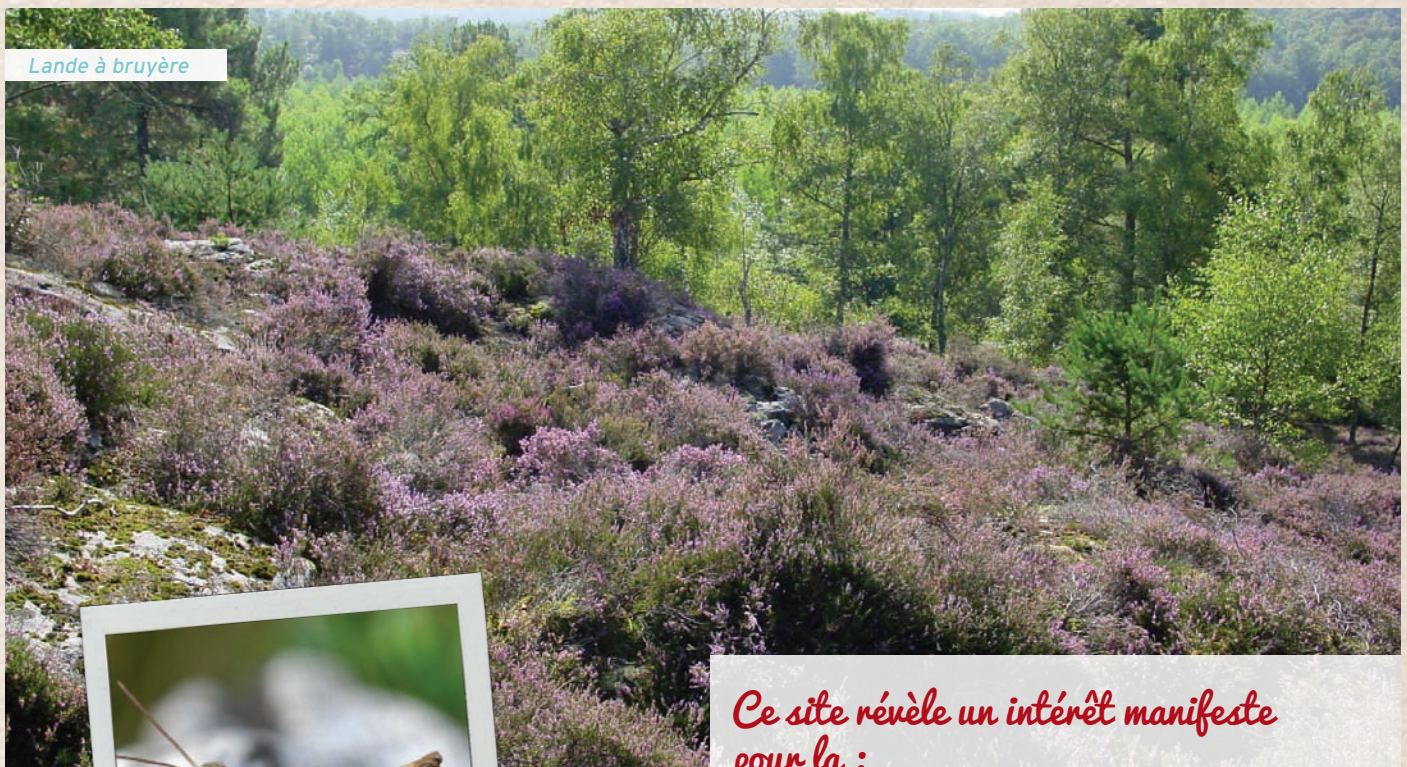
Lande à bruyère

Les milieux notamment forestiers reflètent les potentialités du sol liées à la géologie. Sur des sols très sableux ou sur les tables (pierres) de grès la forêt laisse la place aux landes à bruyères. Sur les sols plus limoneux mais toutefois acides la forêt exprime tout son potentiel par une belle chênaie en mélange avec du châtaignier. En limite de ces deux grandes zones il est possible d'observer des boisements de pins sylvestres et de pins laricio de Corse.