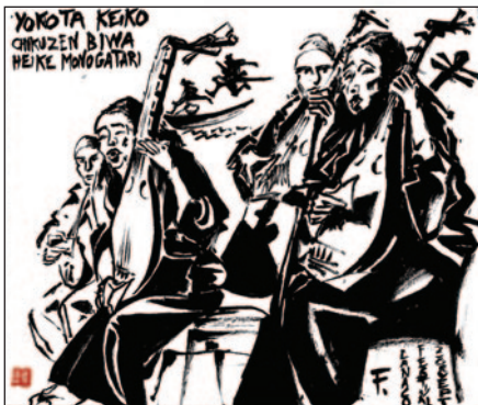
Illustration de Jean-Michel FESSOL réalisée lors de la dernière édition.

Cette flânerie débutera au Complexe sportif et culturel intercommunal (CSCI) à Couloisy le vendredi 27 septembre et prendra fin à l'Horloge d'Ollencourt le dimanche 6 octobre.