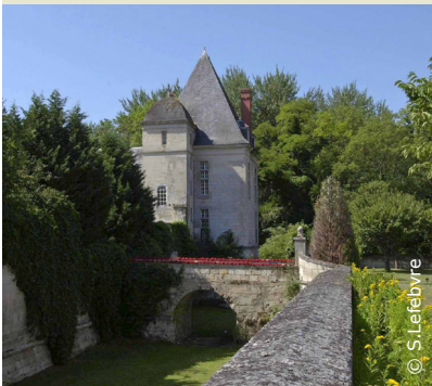
Le château de Cœuvres

INFOS TOURISTIQUES : Office de Tourisme Retz-en-Valois Tél. : 03 23 96 55 10