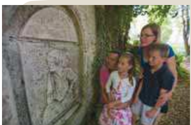
Visite des carrières de Montigny