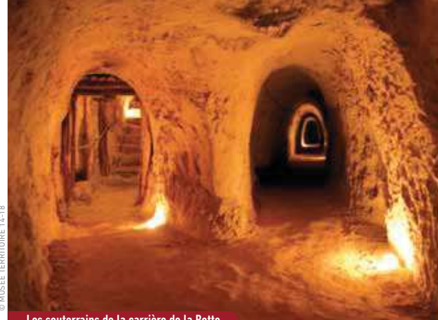
Les souterrains de la carrière de la Botte