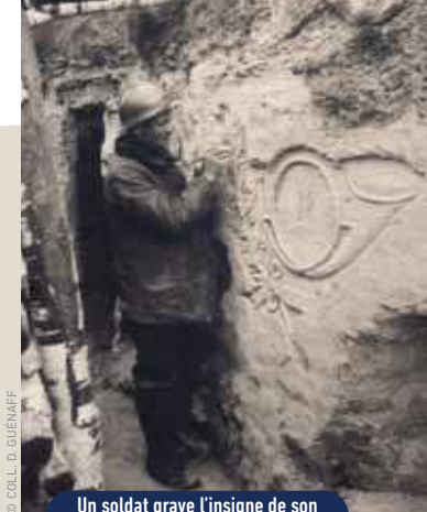
Un soldat grave l'insigne de son bataillon en forêt d'Elincourt, 1916