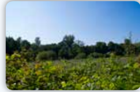
La zone humide.

La commune a fait l'acquisition d'un terrain situé entre les deux plans d'eau actuels. Cette zone constitue une zone dite « humide » par la présence en ces lieux de sources et de zones marécageuses.