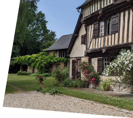
Prieuré de Saint-Arnoult