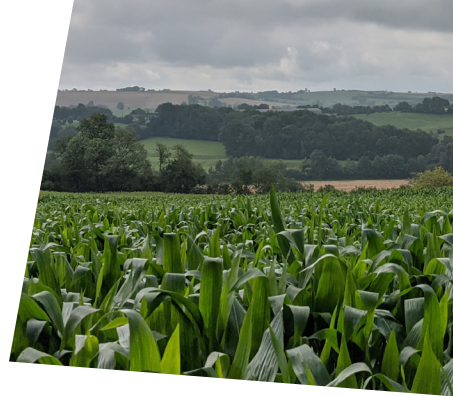
Point de vue sur la commune de Buicourt