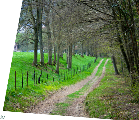
Paysage de Picardie Verte