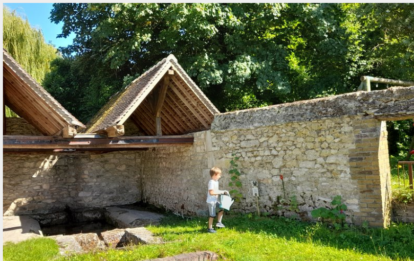
Lavoir Sainte Barbe