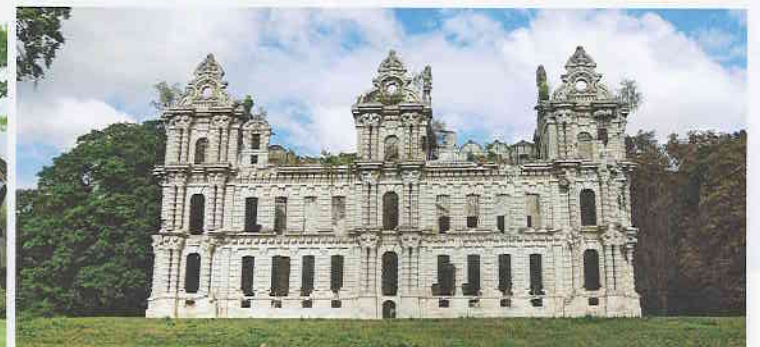
Le château de Mennechet