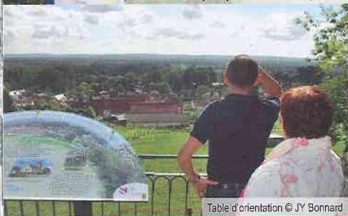
Table d'orientation

Coord. GPS : 49.543520, 2.954257 Distance Ligne Rouge : 5 km