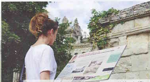
Panneau d'interprétation

Si Ourscamp échappe aux destructions massives de 1915, Chiry subit un dynamitage lors du repli allemand de 1917 et des bombardements en 1918.