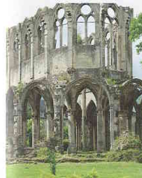
Abbaye d'Ourscamp

Balisage : suivre les indications des panneaux d'interprétation