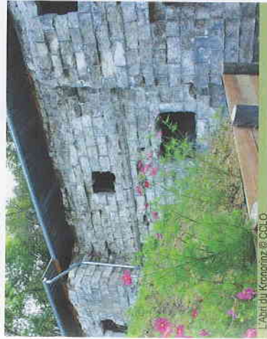
L'Abri du Kronprinz