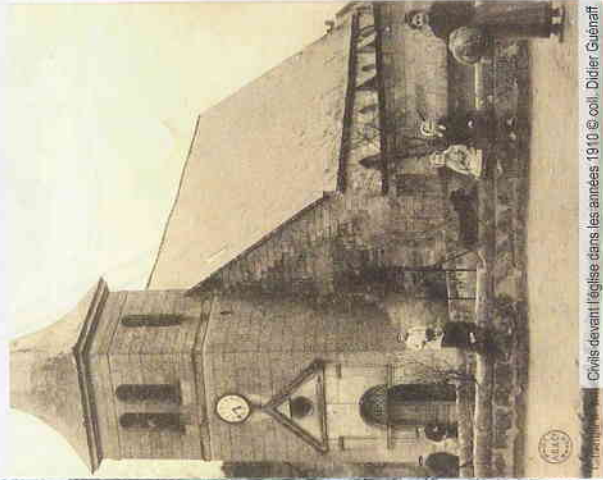
Église devant l'église dans les années 1910

Profitez de cette balade pour...visiter l'Abri du Kronprinz ! Ce blockhaus allemand, centre de commandement régimentaire, est l'un des vestiges les plus imposants de la Grande Guerre sur le territoire. Informations auprès de l'Office de Tourisme Pierrefonds, Lisières de l'Oise : www.destination-pierrefonds.fr / 03 44 42 81 44