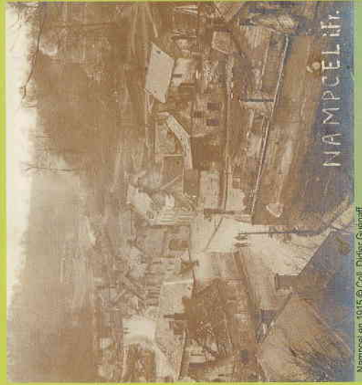
Nampcel en 1915