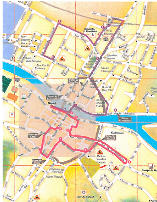
Plan du parcours historique

Du lundi au vendredi de 14 h à 17 h 30 Du mardi au samedi de 10 h à 12 h